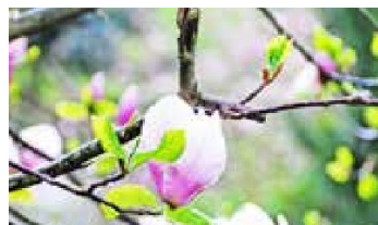
Über 200 Magnoliensorten - auch immergrüne - wachsen in Christiansberg.