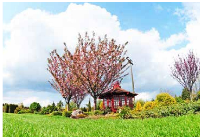
Blauer Himmel, grasgrüner Rasen, blühende Bäume und märchenhafte Pavillons ... paradiesische Zustände im Botanischen Garten.